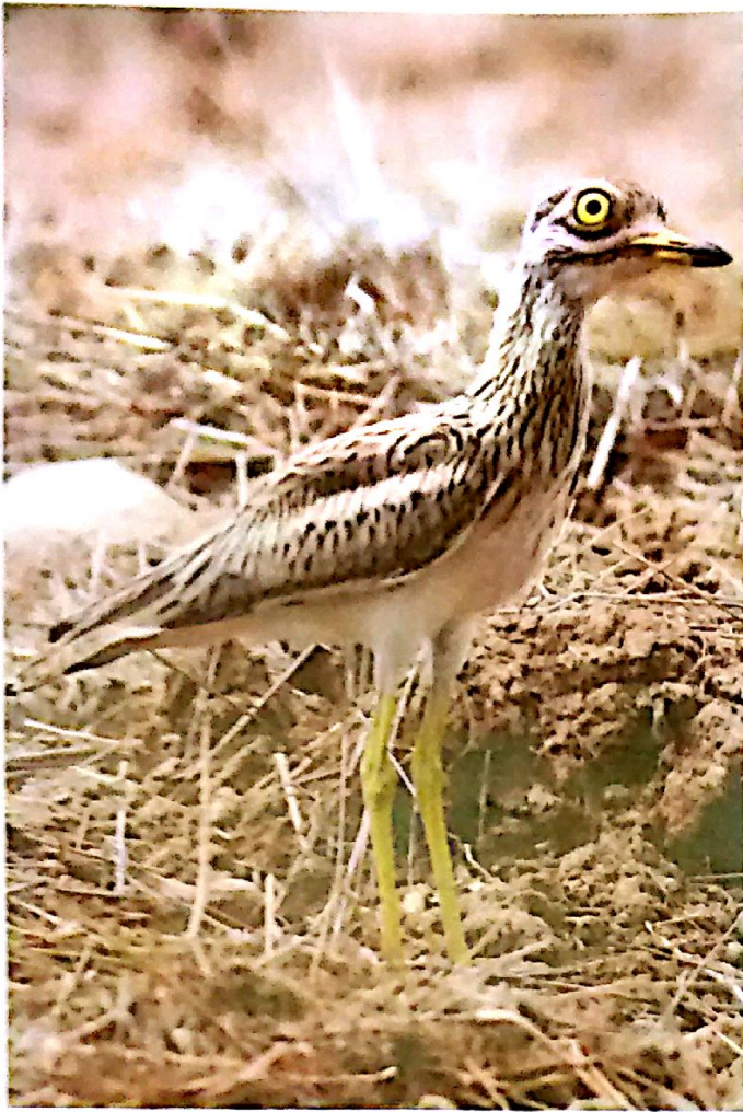
Εικόνα 1: Burhinus oedipnemus (Τρουλλουρία): Μόνιμος κάτοικος αλλά και ανοιξιάτικος και θερινός επισκέπτης στην Κύπρο