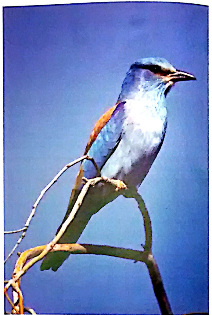
Εικόνα 2: Coracias garrulus (Κράγκα): Μεταναστευτικό αλλά αριθμός ζευγαριών φωλιάζει στην Κύπρο

οπωροφόρα δέντρα, ντεπόζιτα νερού, ποτίστρες, φωλιές, ξερολιθιές, σημεία τροφοληψίας και περίφραξη.