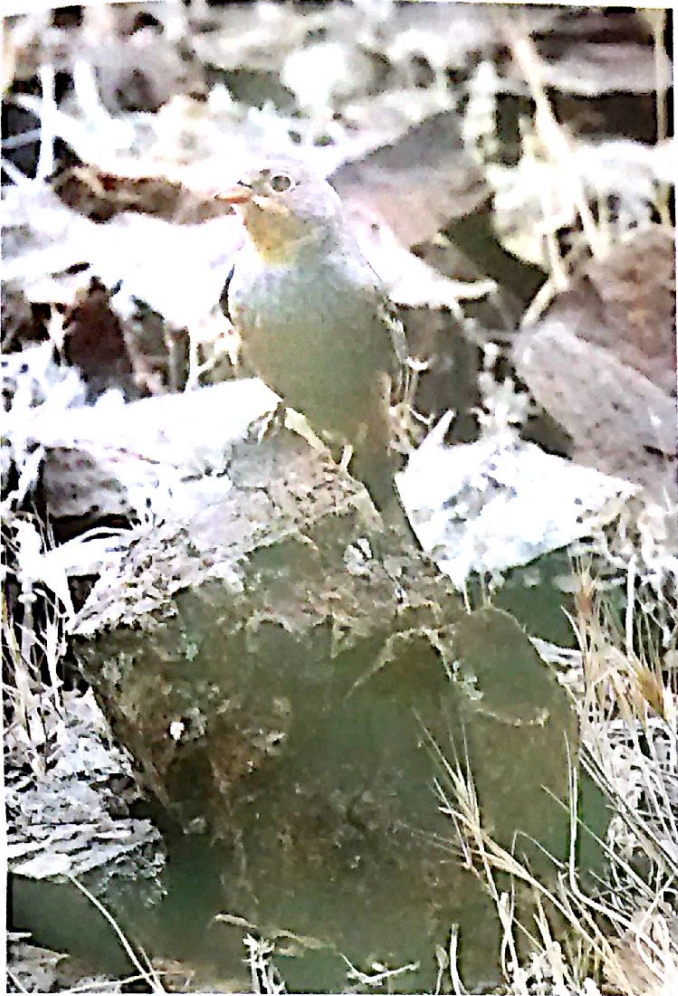
Εικόνα 3: Emberiza caesia (Σιταροπούλι): Μεταναστευτικό που φωλιάζει στην Κύπρο