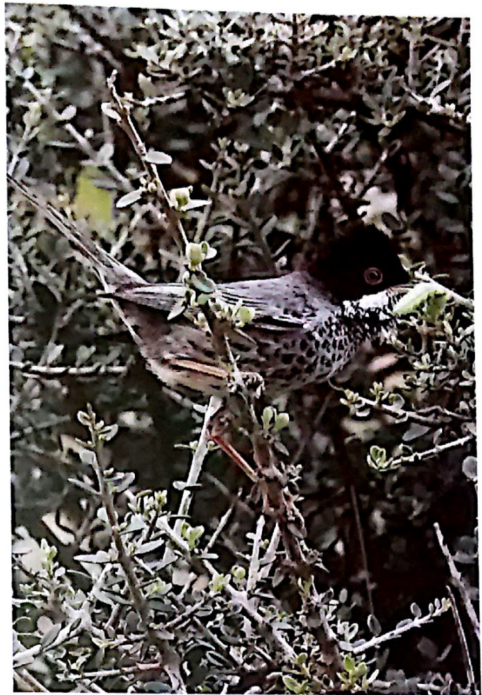
Εικόνα 4: Sylvia melanothorax (Τρυποράσις): Ενδημικό της Κύπρου με κάποια ζευγάρια να μεταναστεύουν στο Ισραήλ