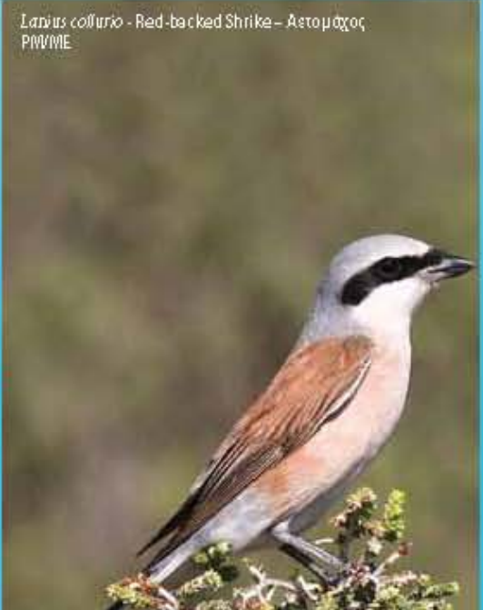
Lanius collurio - Red-backed Shrike - Αετομάχος P/W/M/E

Η ΣΗΜΑΣΙΑ ΤΗΣ ΠΕΡΙΟΧΗΣ ΓΙΑ ΤΑ ΠΟΥΛΙΑ Η Κύπρος βρίσκεται στο σταυρόδρομο τριών ηπείρων και αποτελεί έναν από τους σημαντικότερους μεταναστευτικούς διαδρόμους πουλιών. Το Κάβο Γκρέκο, στο πιο νοτιοανατολικό άκρο του νησιού, χρησιμοποιείται ως ο πρώτος σταθμός ξεκούρασης από αξιόλογα μεταναστευτικά πουλιά, μερικά από τα οποία καταγράφονται μόνο εδώ. THE IMPORTANCE OF THE AREA FOR BIRDS Cyprus, on the crossroads of three continents, is one of the major migratory bird flyways. Kavos Gkreko occupying the most south-eastern edge of the Island is in that respect of special value since it is the first rest station for many important migratory birds, some of which have only been recorded here.