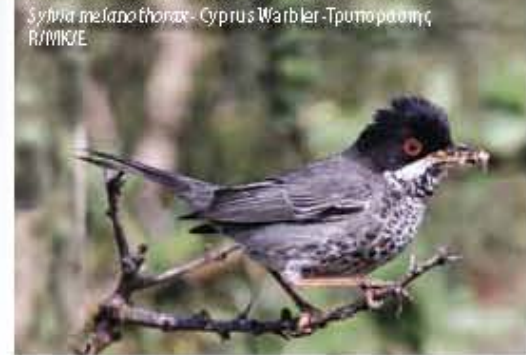
Sylvia melanothorax - Cyprus Warbler - Τρουπορούλης R/MBK

MB: Migrant Breeder AM: Αναπαράγόμενος Μετανοστής R: Resident MK: Μόνιμος Κύπριος PM: Passage Migrant ME: Μετανοστής Επισκέπτης E: Endemic / Ε. Ενδημική LIFE 13 NAT/CY/000176 LIFE FOR BIRDS