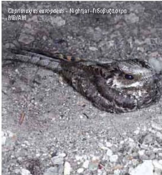
Caprimulgus europaeus - Nightjar - Γιδοβυζοστρα MB/AM