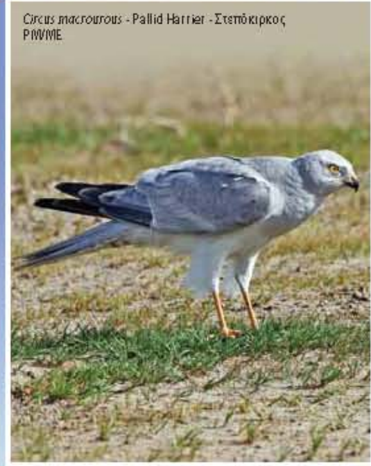
Circus macrourus - Pallid Harrier - Στεπόκιρκος P/MBME

ΑΠΕΙΛΕΣ ΓΙΑ ΤΑ ΠΟΥΛΙΑ ΤΗΣ ΠΕΡΙΟΧΗΣ • Η χρήση αγροχημικών οικιακών μύτων • Η αλλοίωση της φυσικής βλάστησης με τη φύτευση πολλών ξενικών ειδών • Η μετέωρη και ποικίλη διαθεσιμότητα νερού και τροφής • Οι άσσοι και η υδρογεία και η κλιματική αλλαγή • Οι λοιπές δραστηριότητες • Παρόνομα ποταμώματα και λαθροθηρία • Αυξημένη πρόσβαση MAIN THREATS FOR BIRDS IN THE SITE • Heavy use of agrochemicals • Alteration of natural vegetation through planting of alien species • Seasonal scarcity of water and food • Forest fires and climate change • Quarrying activities • Illegal trapping and poaching • Increased access