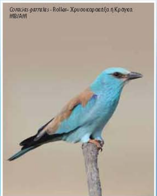
Colaptes cafer - Roller - Χρυσοκαρόαξη Κροακία MB/AM