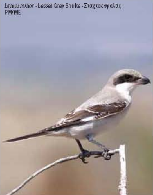
Lanius minor - Lesser Grey Shrike - Σταχτοεφάλας P/MBME