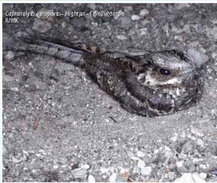
Caprimulgus europaeus - Nightjar - Γιδόβουζοστρα R/W/M