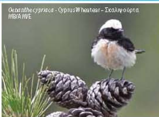
Oenanthe cyprica - Cyprus Wheatear - Σκαλιφούρα MB/AM/E

MB: Migrant Breeder AM: Ανοσογράφος Μετανοστής R: Resident MK: Μόνιμος Κότοκος PM: Passage Migrant ME: Μεταναστευτικός Επικείμενος E: Endemic / E: Εγχώριος LIFE 13 NAT/CY/000176 LIFE FOR BIRDS