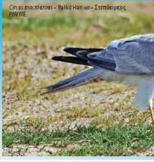
Circus macrourus - Pallid Harrier - Στεπόκιρκος P/W/M/E