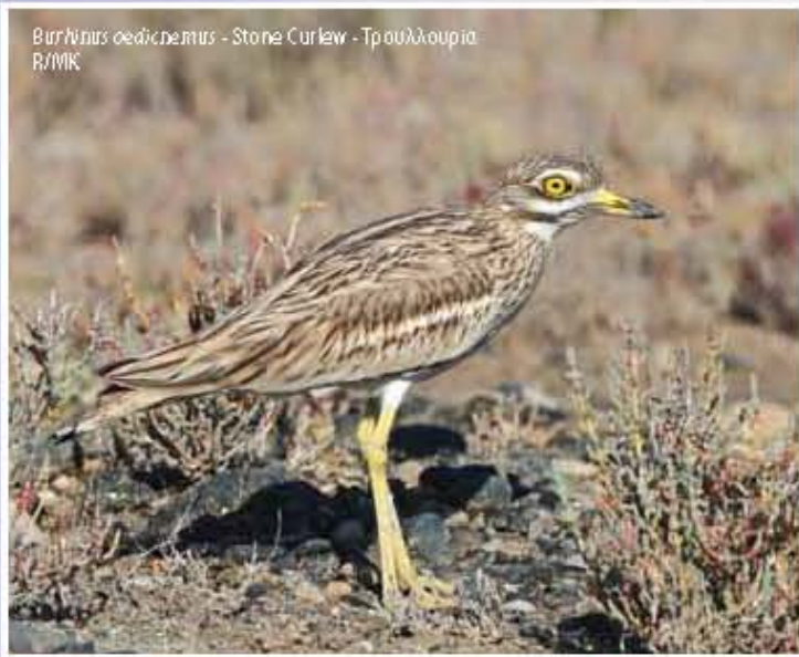
Burhinus oedipus - Stone Curlew - Τρουλλούριδο R/MBK