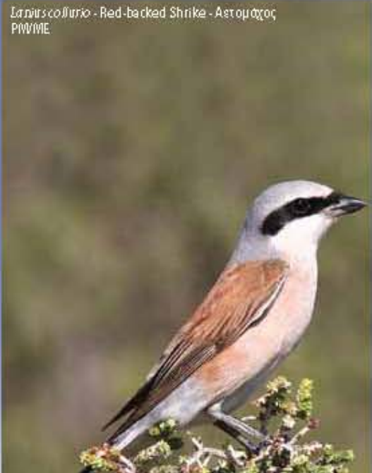
Lanius collurio - Red-backed Shrike - Αετομάχος P/MBME

Η ΣΗΜΑΣΙΑ ΤΗΣ ΠΕΡΙΟΧΗΣ ΓΙΑ ΤΑ ΠΟΥΛΙΑ Οι χαμηλά ληφοί της περιοχής και οι χαρμώδες εκβολές με φρύγανα, μαζί με τις περιοχές σπέρνων, συνθέτουν ένα ιδιαιτέρως σημαντικό βιότοπο για τα πουλιά, καθώς η περιοχή παραμένει ισχυρικά αδιάφορη από σημαντικές αναστάσεις. THE IMPORTANCE OF THE AREA FOR BIRDS The low hilly uncultivated areas, alternating with garigue vegetation and cereals, create an ideal habitat for certain bird species, since the site remains largely free from any severe human disturbance.