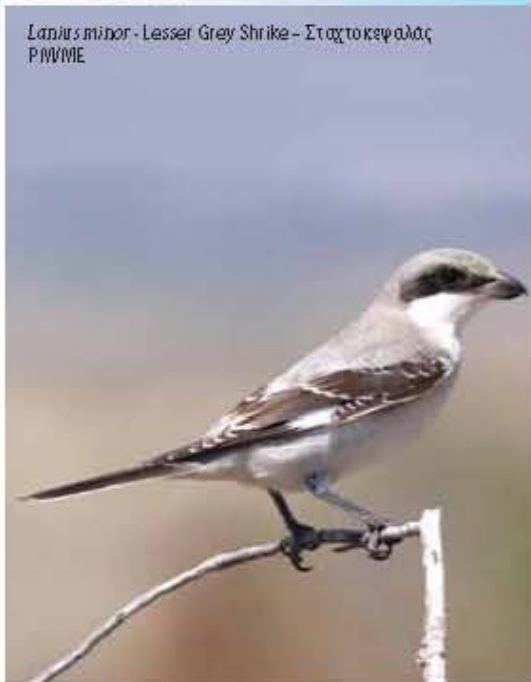
Lanius minor - Lesser Grey Shrike - Στασκοκεφαλάς P/W/M/E