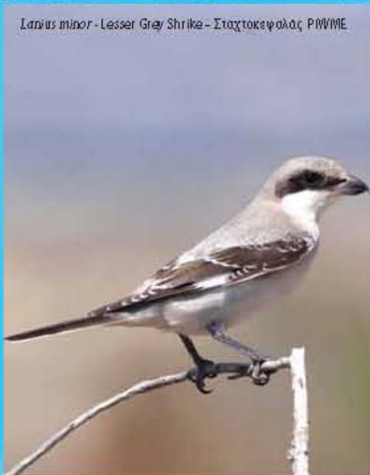
Lanius minor - Lesser Grey Shrike - Σταχτοκεφαλάς P/MBME