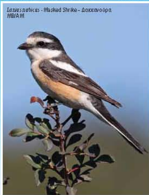
Lanius rubicus - Masked Shrike - Δακκανούρα MB/AM