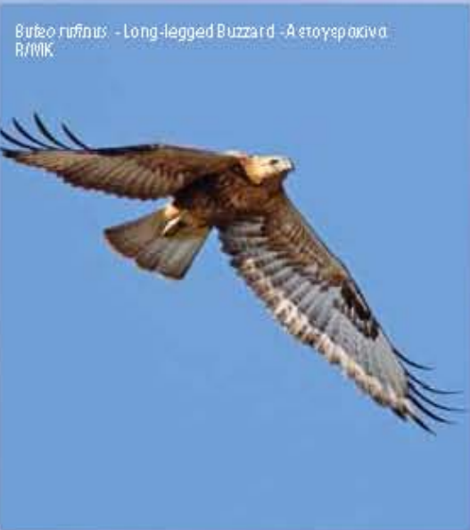
Buteo tibialis - Long-legged Buzzard - Αετογαράκινα R/MBK