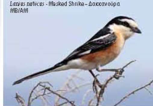
Lanius rubicus - Masked Shrike - Δακκανούρα M/B/A/M

M/B: Migrant Breeder A/M: Αναπαράγμενος Μετανοστής R: Resident M/K: Μόνιμος Κατοίκος P/M: Passage Migrant M/E: Μεταναστευτικός Επικρατής E: Endemic / E: Εξοχικό LIFE 13 NAT/CY/000176 LIFE FOR BIRDS