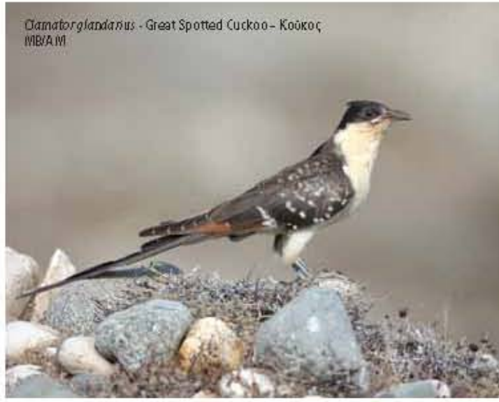
Cuculus glandarius - Great Spotted Cuckoo - Κούκος MB/AM