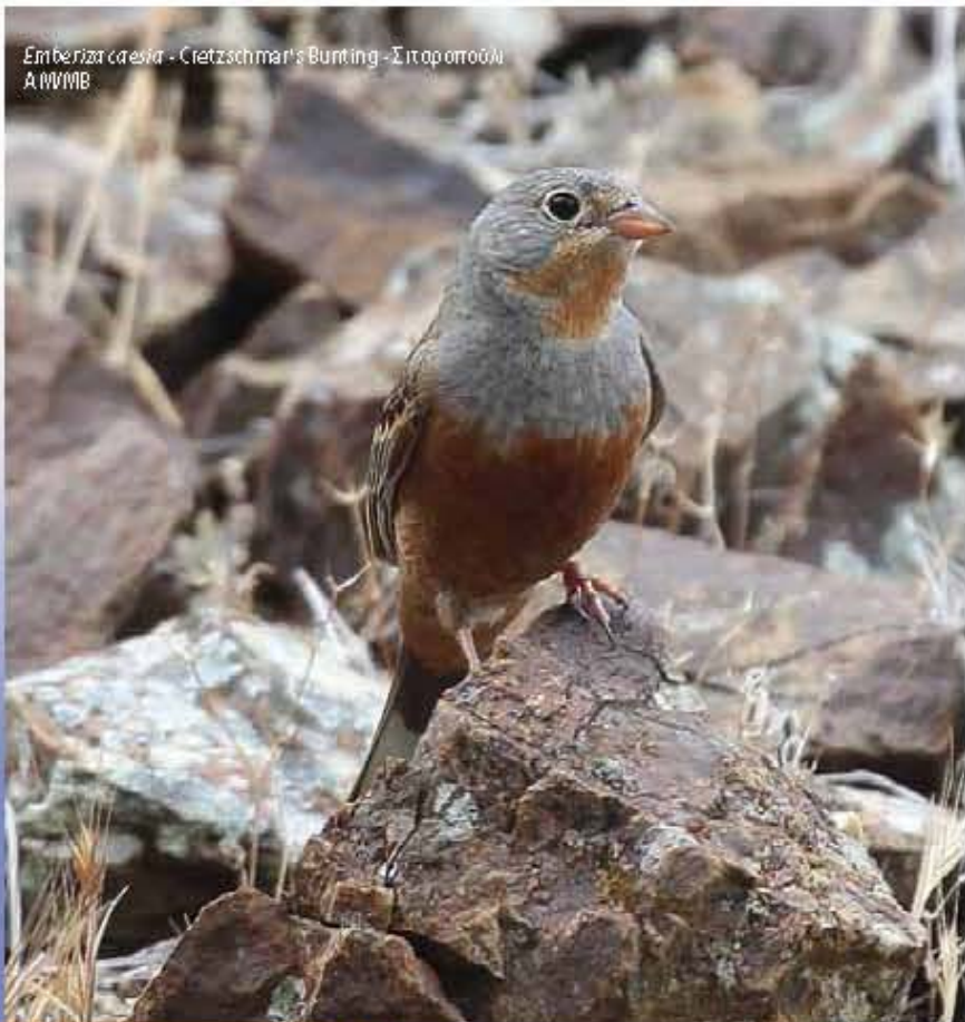
Emberiza caesia - Cietzschmar's Bunting - Σιταροπούλι A/MBMB

Η ΣΗΜΑΣΙΑ ΤΗΣ ΠΕΡΙΟΧΗΣ ΓΙΑ ΤΑ ΠΟΥΛΙΑ Οι χαμηλά ληφοί της περιοχής και οι χαρμώδες εκβολές με φρύγανα, μαζί με τις περιοχές σπέρνων, συνθέτουν ένα ιδιαιτέρως σημαντικό βιότοπο για τα πουλιά, καθώς η περιοχή παραμένει ισχυρικά αδιάφορη από σημαντικές αναστάσεις. THE IMPORTANCE OF THE AREA FOR BIRDS The low hilly uncultivated areas, alternating with garigue vegetation and cereals, create an ideal habitat for certain bird species, since the site remains largely free from any severe human disturbance.