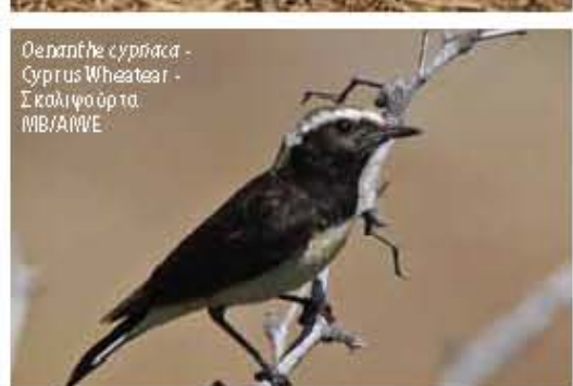
Oenanthe cyriaca - Cyprus Wheat-eater - Σκολιφούρτα MB/AMB