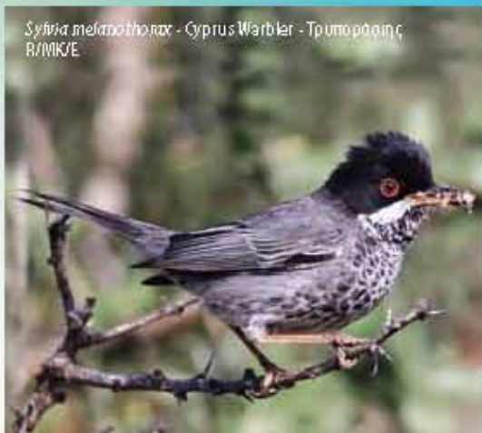
Sylvia melanothorax - Cyprus Warbler - Τρυποράνη R/W/M/E