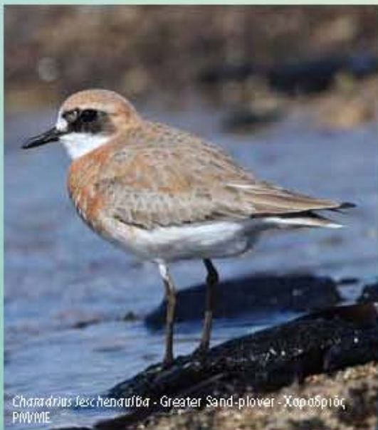
Charadrius leschenaultii - Greater Sand-plover - Χαροδρίδι P/W/M/E