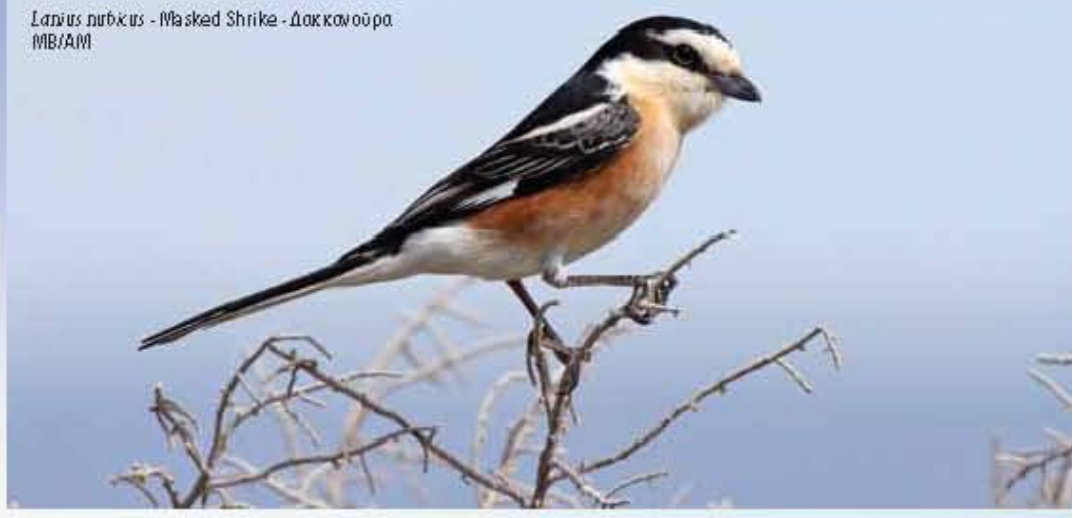
Calandrella cinerea - Cala Lark - Μουροτράσιλος R/MBK