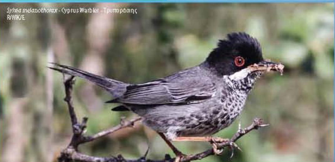
Sylvia melanothorax - Cyprus Warbler - Τρυπαράσιος R/MBK/E