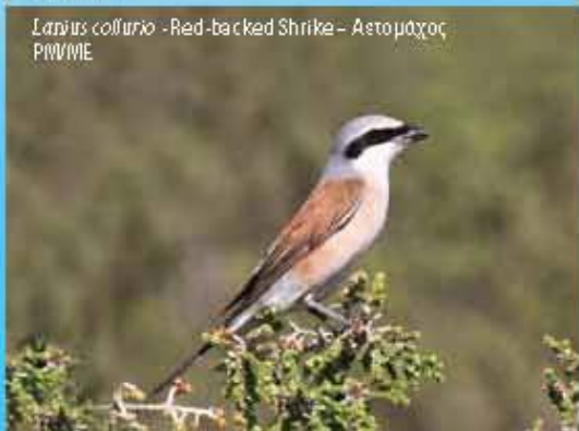
Lanius collurio - Red-backed Shrike - Αετομαχός P/MBME

The diversity of vegetation composed by dwarf garrigal vegetation and dry agriculture fields with scattered low trees, provide an excellent vegetation and dry agriculture habitat for desert and savanna species, especially for long distance migrants. The river flowing along Pyrgia and Klavdió villages is also one of the major migration corridors of Cyprus which used by a large number of migrants.