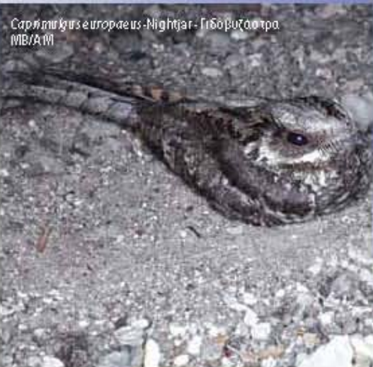
Caprimulgus europaeus - Nightjar - Γιδόβουζοτρο MB/AMB