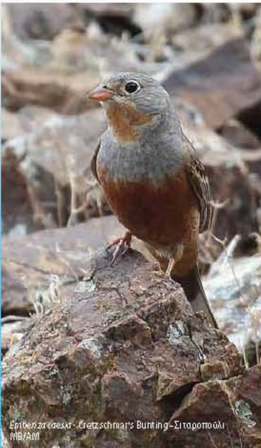
Eriopelia caesia - Cretzschmar's Bunting - Σιταροπούλι MB/AM