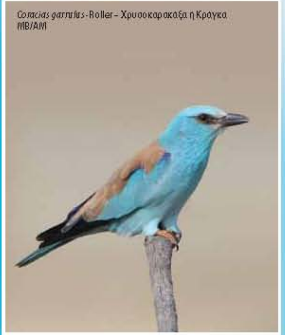
Coracias garrulus - Roller - Χρυσοκαράξα ή Κράγκα M/B/A/M

ΑΠΕΙΛΕΣ ΓΙΑ ΤΑ ΠΟΥΛΙΑ ΤΗΣ ΠΕΡΙΟΧΗΣ • Παρόνομη παγίδευση, σύλληψη και θανάτωση • Άλλοιωμένες φυσικές βλάστες με τη φύτευση ξενικών ειδών • Η παρενόχληση από το μεγάλο αριθμό εγκαταστάσεων και την εκπομπή κινηματογράφων • Η έλλειψη νερού και τροφής • Οικιστικές πιέσεις και η κλιματική αλλαγή • Η επέκταση των οικιστικών συνθηκών στην περιμετρία της περιοχής MAIN THREATS FOR BIRDS IN THE SITE • Illegal trapping and killing of birds • Alteration of natural vegetation through planting of alien species • Disturbance by visitor activities and hunting dog training • Scarcity of drinking water and food • Forest fires and climate change • Extensive housing development in the perimeter of the site